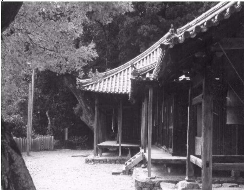
福勝寺本堂（重文）ご本尊千手観音菩薩

大日如来・弘法大師・四天王・三十三観音 薬師如来・地藏菩薩・虚空蔵菩薩・不動明王 大峰役行者