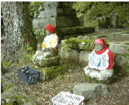
奥の院のこの場所でさびしく亡くなっていた人々か？でも温かさがある光景