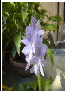
蓮 睡に咲く先関玄

生かせいのちとは生命ばかりではありません。一切の生物が育んでいる今の時間をどう生かすかが最も大切なことです。私達が今の時間を積極的に生かせること。限られた時間を無駄に消費せず、人類の子孫繁栄のために生かせようではありませんか。喜びには小さい、大きいはありません。喜べる社会、家庭を！