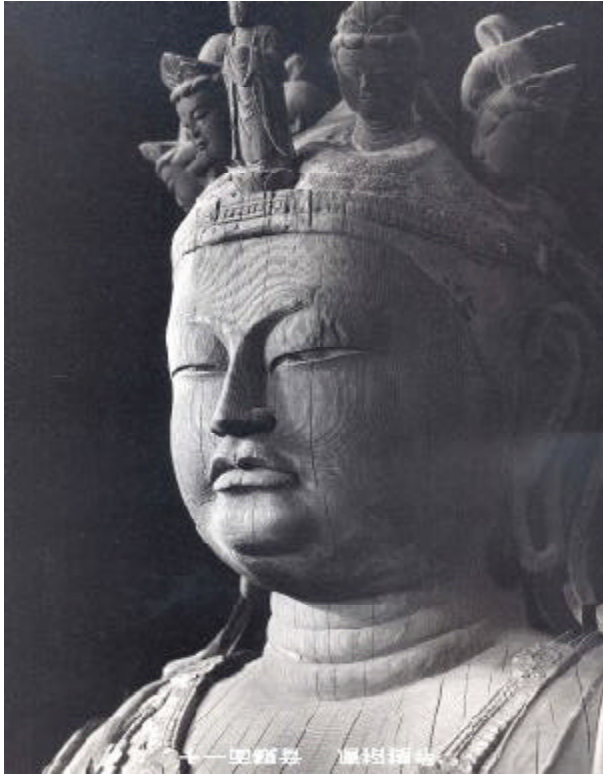
十一面観世音菩薩