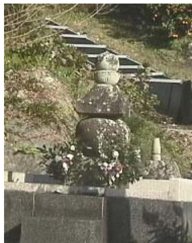
石段の登り口の五輪塔 (岩屋山 福勝寺で)