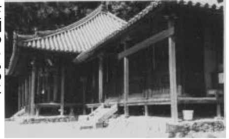
当岩屋山 福勝寺の本堂(奥)と求聞持堂(手前) 下津町立歴史民俗館 学術員 中谷澄雄

求聞持堂を行つ堂で、瀧祖頼宣が自分のために創建したものである。棟札には「嚴屋山求聞持堂創建主従二位行棒大納言源頼宣卿慶安三年一六五〇庚寅春一月穀旦、筆者永田道慶」とある。十月四日、福勝寺を訪れる。二度目である。本堂前の土塀に沿って「莊嚴具寄附連名標大