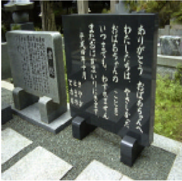
高野山奥の院墓地で

昨年秋、奥の院を参詣に訪れた。喜多郎作曲の「空海の旅」の高野山の幻想が大自然の響きの中に心が浸る。