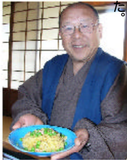
毎日新聞掲載より

「何とか需要を増やすには料理が大きな鍵を握る」との話がありました。父もどちらかと言いますと料理が上手でした。酒のあては自分で作り、柑橘の香り、酢を美味しく生かしていた。